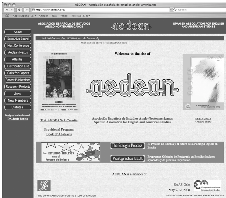
Página de inicio del sitio web de AEDEAN www.aedean.org

If you wish to subscribe, send an e-mail message to the list moderator jperez@uvigo.es from the e-mail account you want to add to the list. After confirming your affiliation status, your e-mail account will be subscribed to the list.