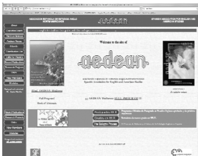
Página de inicio del sitio web de AEDEAN www.aedean.org

If you wish to subscribe, send an e-mail message to the list moderator jperez@uvigo.es from the e-mail account you want to add to the list. After confirming your affiliation status, your e-mail account will be subscribed to the list.